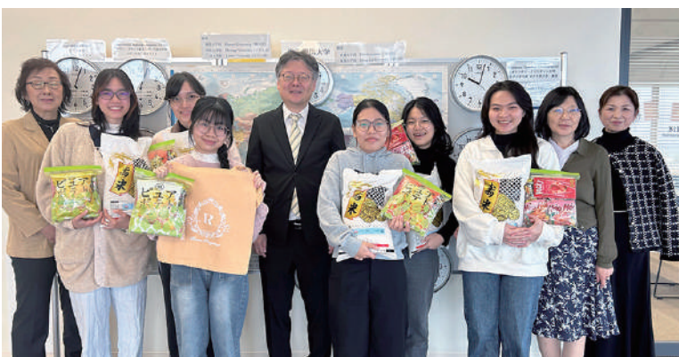
茨城キリスト教大学の東海林学長と国際交流センター職員と留学生

今後も地域の人と連携をし、学生支援活動をおこなっていきけるよう取り組んでいきたいと思っています。