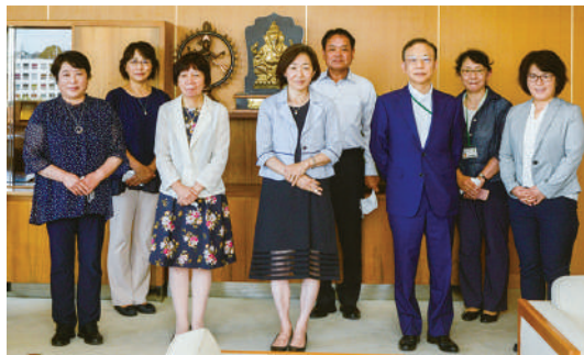
大学関係者と県連会長と事務局

県連は常磐大学と連携をし、ベトナムの大学との橋渡しや青少年・若者育成活動の充実に努めていくことを確認しました。