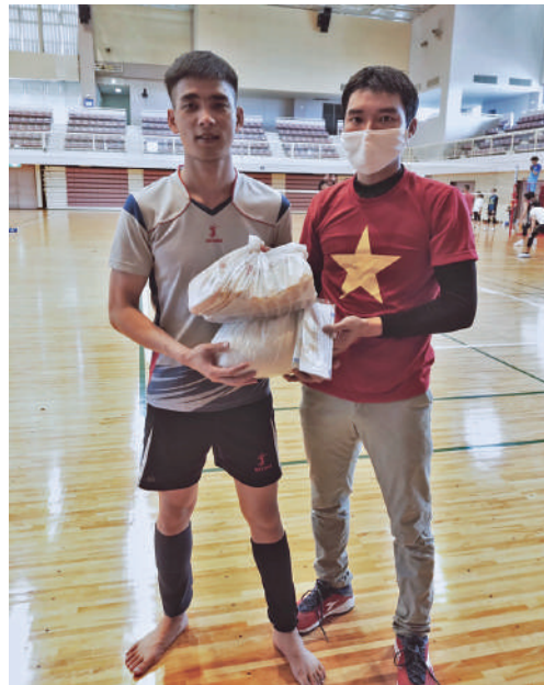
支援された物資を受け取るバレーボール大会参加者

茨城ベトナム人協会を通して、県内にいる留学生や実習生、エンジンニアに支援物資が配布されました。 7月12日ひたちなか市内で行われたベトナム人の親睦会(バレーボール大会)に集まった多くの人たちに、県連やフードバンク、ベトナム人協会からの支援物資が配られました。 受け取った人たちは口々に「こんなにもらっていいんですか、助かります」「仲間に会えただけでもうれしいのに、ラーメンやお米をもらえてとても感謝です」と話して大事そうに持ち帰りました。