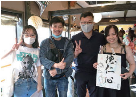
タム・チーさんから言葉を書いてもらった実習生は

「これで少し頑張れます。来てよかった」と話し、食糧を大事そうに抱えて帰りました。