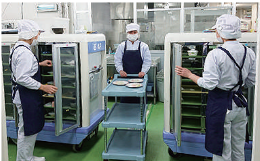
出来上がった食事を各施設に

そのため、来日1年目には日本語や日本文化の研修が2ヶ月ほど、1年後には技能実習生本人が所定の技