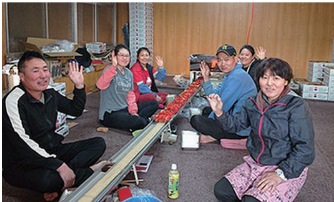
銚田市の檜山農園でも多くの外国人労働者が働いています

毎年4月に銚田市の檜山農園で行われる、いちご狩りが、今年はコロナウィルス感染症の影響により、中止となりました。