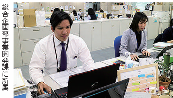
総合企画部事業開発課に所属

専門は科学でしたが、ぜひ日本の企業に勤めてみたいという思いから、2017年5月、関彰商事に就職しました。1年目は堪能な日本語を生かしOA機器の営業を行いました。先輩と行く