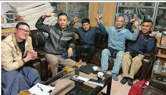
菊池興業で働く5人の実習生

今の課題はコミュニケーションで、ある程度は日本語で話しますが、ポケトーク(音声翻訳機)やジェスチャーを交えながら会話を