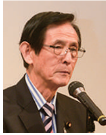
来賓あいさつ 岡田参議院議員