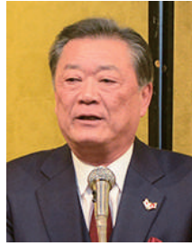
乾杯 中川県連会長代行