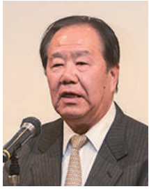
閉会のことば 小野県連副会長