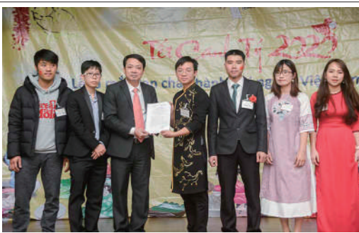
ベトナム大使館から協会としての認定書を受け取る代表ら