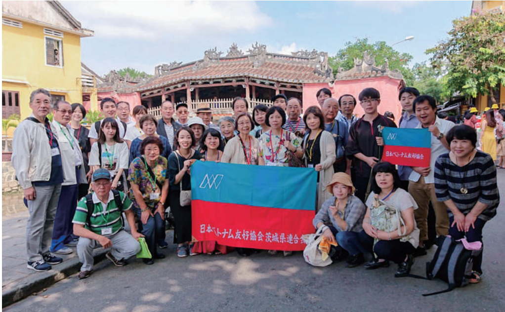
第23次友好訪問団、ホイアン日本橋の前で

明けましておめでとうございます。皆様におかれましては、希望に満ちた新年をお迎えのこと、心からお慶び申し上げます。併せて、日頃