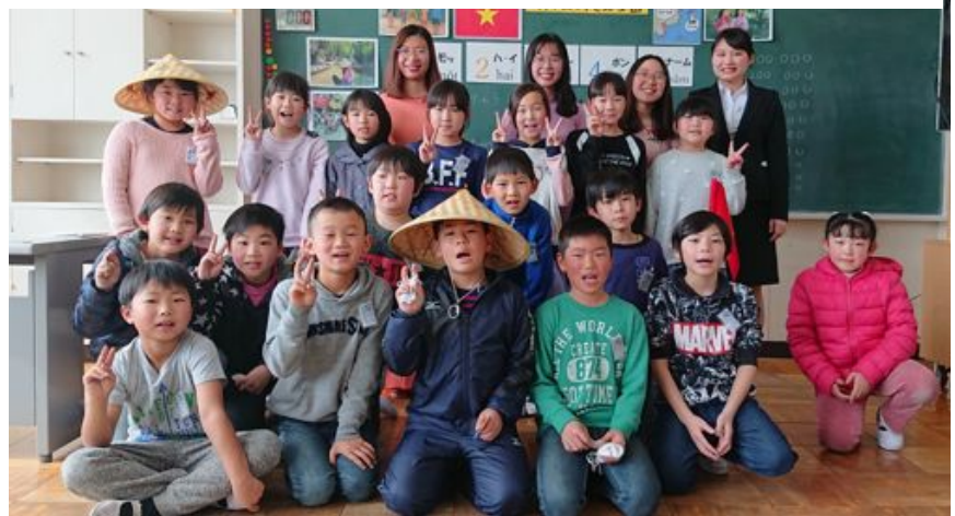
ベトナムを紹介する授業を楽しんだ児童たちと留学生ら

県連青年部が2月19日、銚田市旭西小学校の3年生を対象にベトナムを紹介する授業を行いました。茨城県と銚田市は2020オリンピック・パラリン