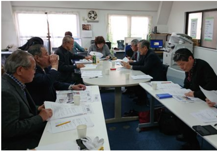
全国総会など議題に開かれた常任理事会

第65回全国総会は5月25、26日、奈良支部が中心となり開催し、奈良大学教授の記念講演の他入管法改正に伴う動きと対応等について話し合う予定です。次回常任理事会は4月6日に行われます。