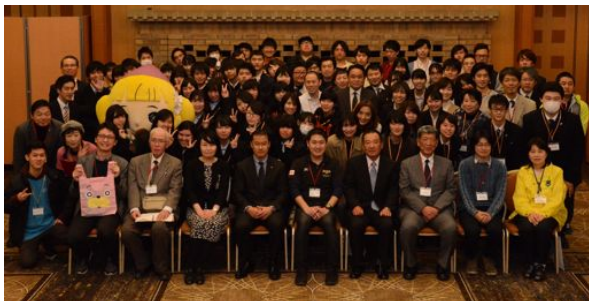
若者フォーラムの参加者

また、ポスターセッションも、同世代の子たちの活動を見ることができ、それぞれの活動から自分たちにも生かせる事があり、今後のベトナムでの青年部の活動に生かしていきたいと思いました。(1面に若者フォーラム記事掲載)